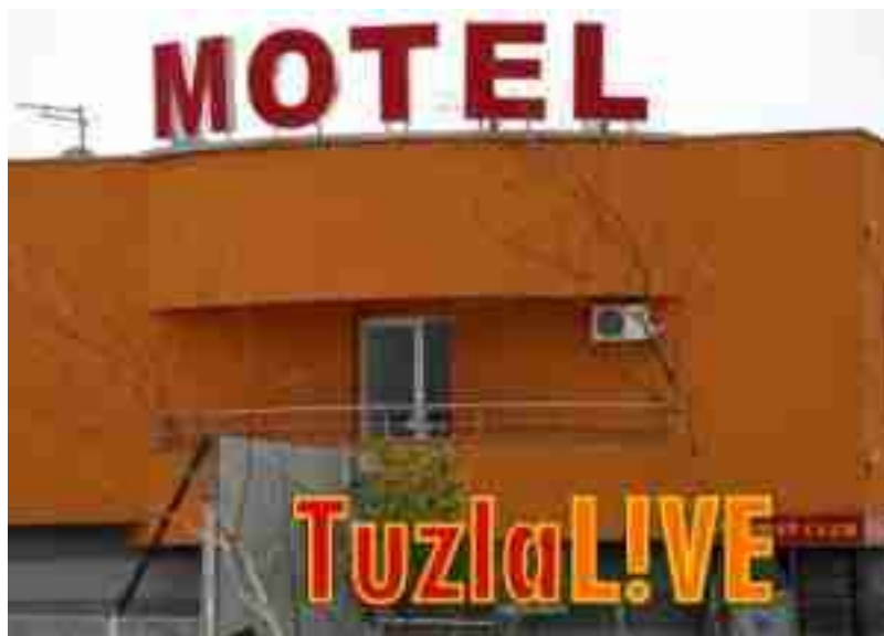
Motel Tuzla u Sickom Brodu