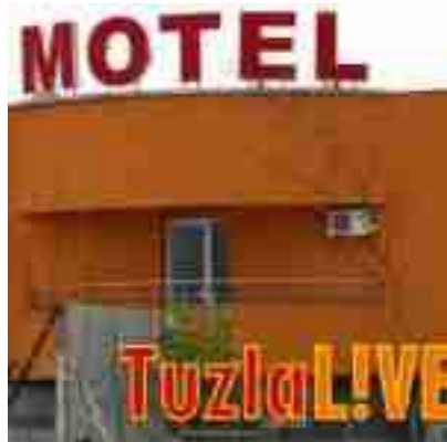
Motel Tuzla u Sirkom Brodu